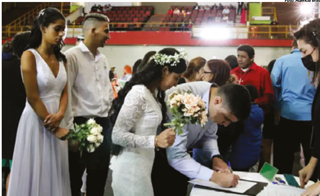
Apesar do ocorrido, a Defensoria afirma que está lutando para a realização do evento na cidade

Em um trecho do documento, a Defensoria explica que instituições e entidades chegaram a divulgar a realização do casamento coletivo para o dia 2 de dezembro deste ano, entretanto, a realização de casamentos comunitários depende da anuência do titular do Cartório de Registro Civil local e autorização privativa