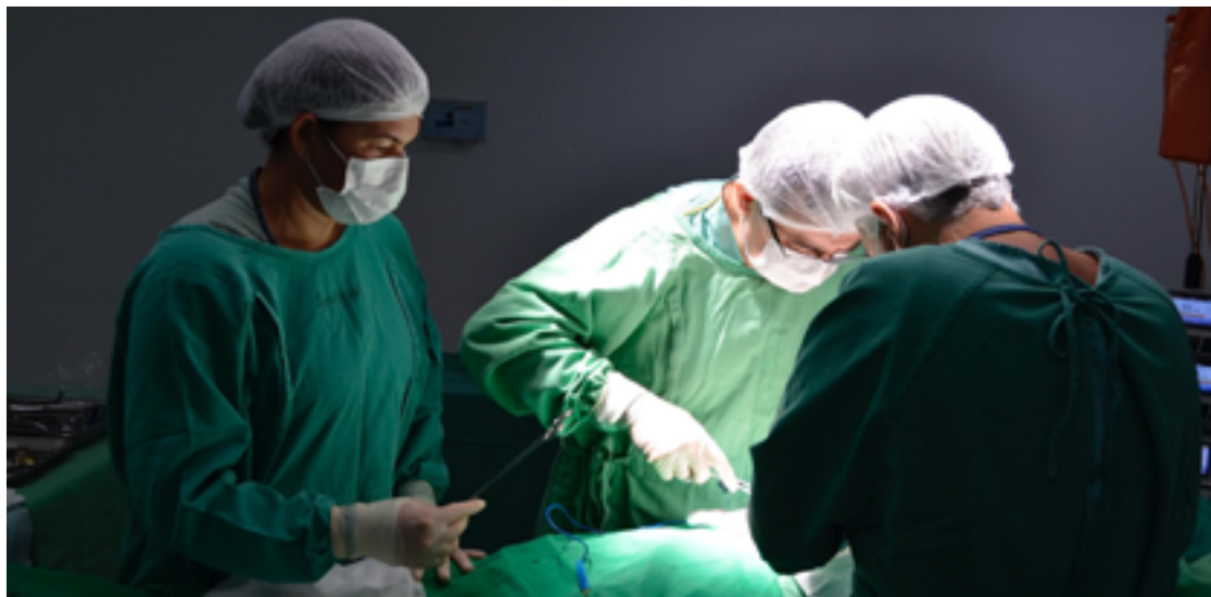
Profissionais do HCN, unidade do Governo de Goiás em Uruaçu, durante a captação de rins em doador de 59 anos que teve morte encefálica

Entre os doadores estão um homem de 34 anos do qual foram captados rins e córneas;