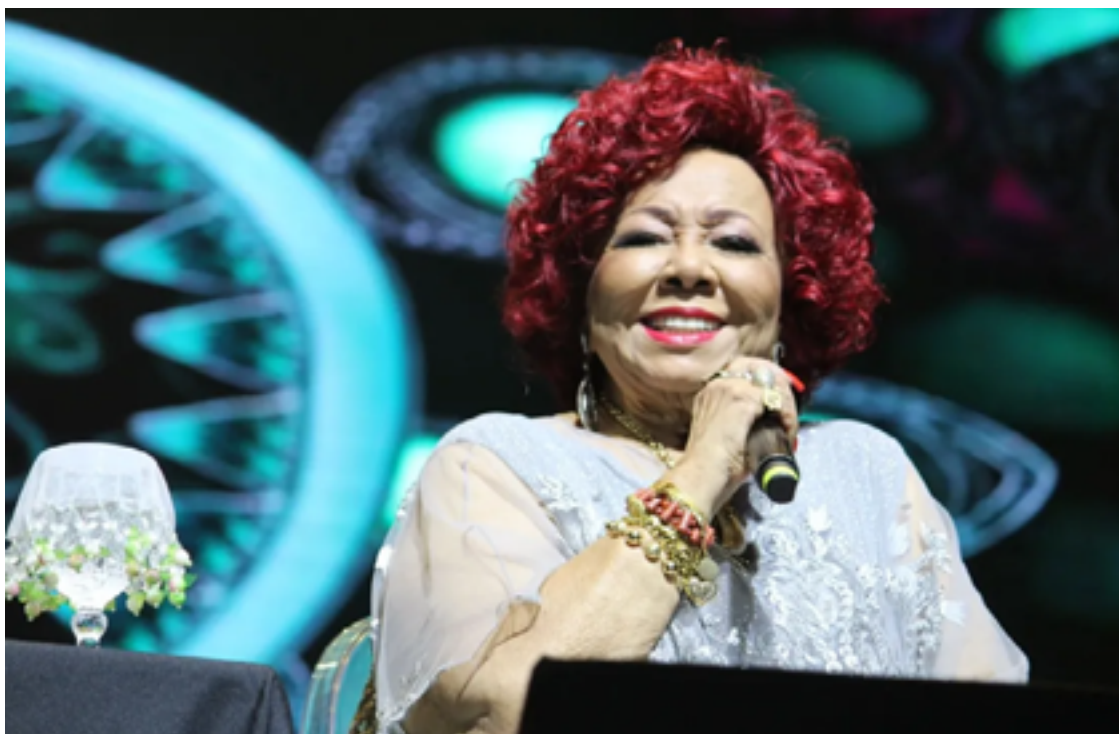
Alcione Marrom comemora 50 anos de carreira em shows lotados pelo Brasil

“Graças a Deus que essa nova geração me acompanha, porque, o que seria de nós senão fosse a nova geração. Eles nos acompanham com alegria, com delicadeza, com respeito, eu gosto muito disso. Então o samba já teve seus momentos de rejeição nesse país, mulher não vendia disco, Clara Nunes foi a primeira mulher a vender 100 mil discos, ela quebrou esse tabu e depois nós viemos atrás de Beth Carvalho. Graças a Deus essas coisas mudaram e