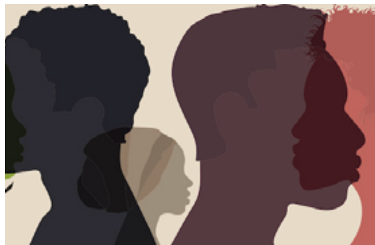
Desigualdade racial nos partidos brasileiros é mais intensa entre as mulheres

Para chegar a esses números, o estudo usou o Repositório de Dados Eleitorais do TSE (Tribunal Superior Eleitoral), em que são divulgados microdados das eleições e que reúne características dos candidatos – como gênero, idade, ocupação e patrimônio declarado – e, desde 2014, a raça autodeclarada.