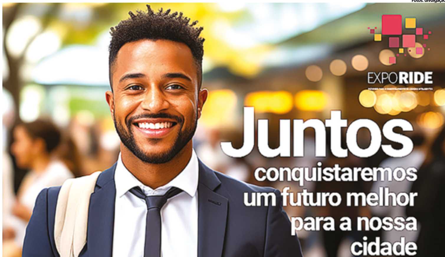
O programa ExpoRide irá trabalhar no desenvolvimento dos 33 municípios do Entorno com projeto de diagnóstico de potencialidades

Em 2023, se estendendo até maio de 2024, a primeira etapa do Programa EXPORIDE prevê uma agenda de ações, divididas em 5 grandes frentes de trabalho, em 12 municípios da RIDE-DF: Águas Lindas de Goiás, Alexânia, Cidade Ocidental, Calzadão, Cristalina, Formosa, Luziânia, Novo Gama, Padre Bernardo, Planaltina, Santo