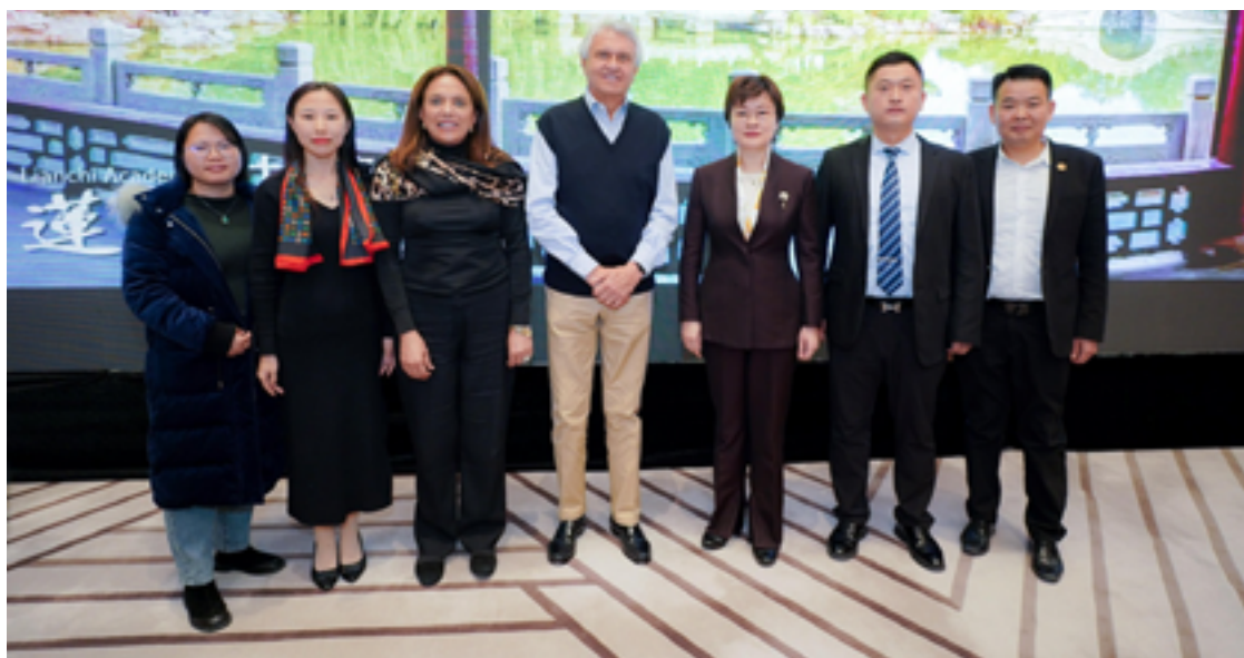
Governador em metrópole chinesa que está sendo construída com ciência e tecnologia avançadas

A resposta foi positiva. Em discurso, Jin Hui enfatizou que o desenvolvimento e a cooperação em benefício mútuo estão no foco de Hebei e que devem ganhar novo ritmo a partir de agora, com relações mais estreitas. “Queremos aprofundar a cooperação com os domínios de planejamento urbano, construção de infraestrutura e tecnologia da informação. Será uma parceria estratégica”, afirmou ela, lembrando que os presidentes do Brasil, Luiz