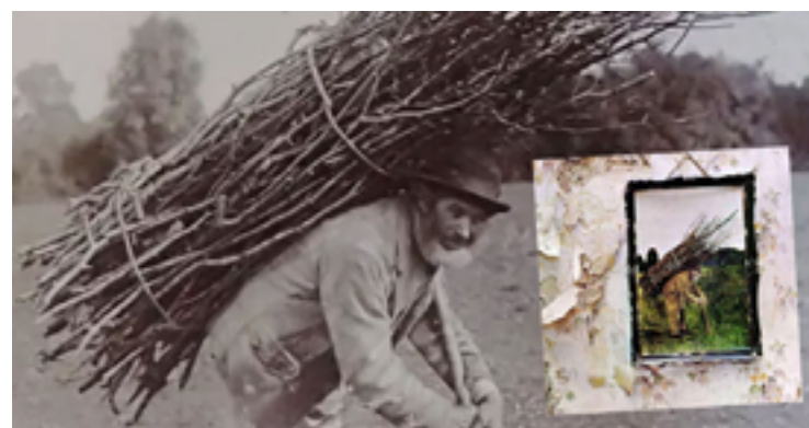
Mistério do homem da capa do 4º LP do Led Zeppelin é resolvido após 50 anos