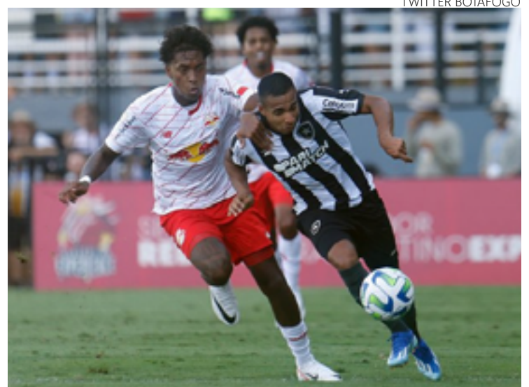
Red Bull Bragantino arrancou o empate em 2 a 2 com o Botafogo nos acréscimos da partida