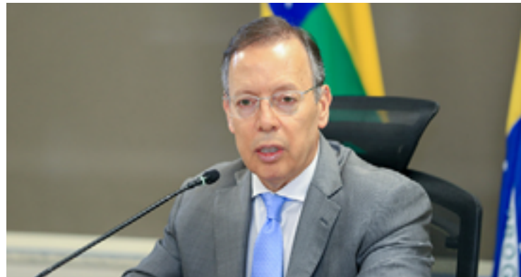
Carlos França: fortalecimento da Justiça nos estados