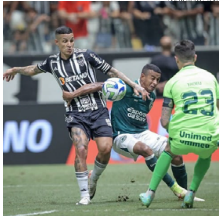
No final da partida, o Esmeraldino que jogava com um a mais, fez um gol mas não deu para, pelo menos, empatar o jogo