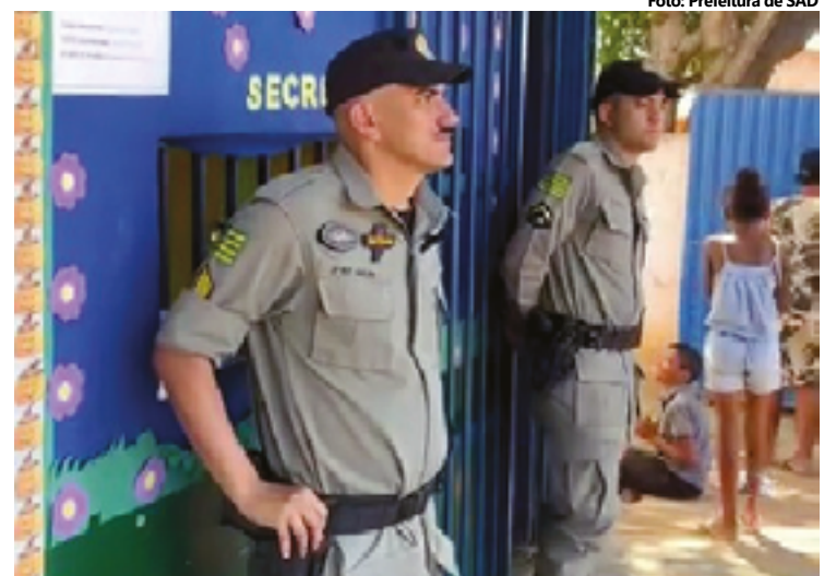
O objetivo da ação é garantir mais segurança ao ambiente escola

Segundo os gestores, o intuito é fomentar, inicialmente, a parte de segurança alimentar e nutricional, colocar algum alimento a mais na mesa e, posteriormente, se preparar para acessar os mercados institucionais, seja nas feiras, cooperativas ou associações.